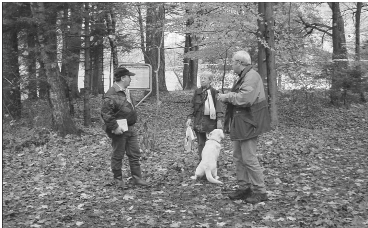
Aufmerksam wird dem Richter nach abgelegter Arbeit des Hundeteams der Bewertung zugehört.

Die SKG Glarnerland ist auch im Internet unter www.skg-glarnerland.ch mit interessanten und aktuellen Informationen vertreten.